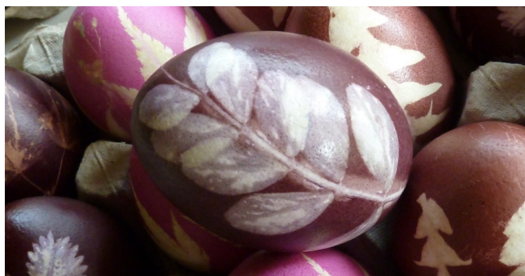
Mit dem Kauf der schönen Ostereier wird einer Kenianerin bei der Ausbildung geholfen.

Die Familien Glattfelder und Knöpfli setzen sich aktiv für arbeitsbetroffene Menschen in Kenia ein. So auch zur Osterzeit. Mit dem Verkauf von hübsch gestalteten Ostereiern soll der Kenianerin Agnes Njokes geholfen werden, ihr Lehrstudium zu finanzieren und ihr Wissen danach an die Kinder weiterzugeben. Der Ostereierverkauf findet am Wochenmarkt in Winterthur statt: 1. und 4. April am Stand von Sunnebuel-Produkte in der Steinberggasse vor dem Dritte-Welt-Laden. RED.