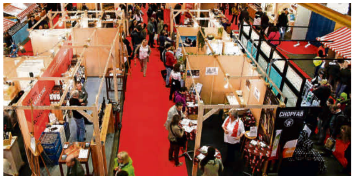
«Cucina e tavola» bietet am kommenden Wochenende in der Reithalle die Gelegenheit, Neues auszuprobieren und mehr über ein Produkt zu erfahren.

Freitag, 18. März bis Sonntag, 20. März Reithalle Winterthur, www.cucina-e-tavola.ch Öffnungszeiten: Freitag 16 bis 22 Uhr, Samstag 11 bis 21 Uhr, Sonntag 11 bis 18 Uhr Kleine Reithalle: Freitag und Samstag bis 24 Uhr www.cucina-e-tavola.ch