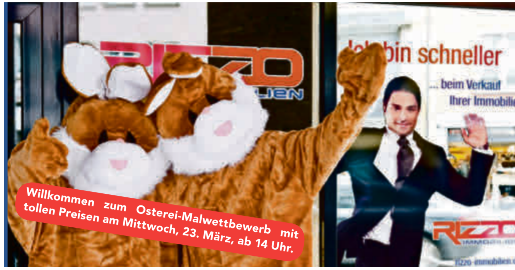
Besuch am Mittwoch vor Ostern – Bei Rizzo Immobilien ist auch der Osterhase schneller. pd.

Preis: VB CHF 700 000.– zzgl. 2 TG-PP à CHF 25 000.–