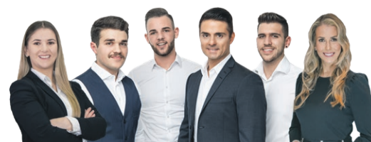
Ihr Team von Rizzo Immobilien. zvg

Wir stehen Ihnen bei Fragen und Anliegen rund um den Kauf und Verkauf von Immobilien sehr gerne kostenlos und unverbindlich zur Verfügung – persönlich, telefonisch, online oder vor Ort bei einem köstlichen italienischen Espresso in unserem Immobilienshop an der Stadthausstrasse 12 in der Winterthurer Altstadt. pd