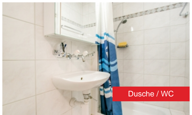
Dusche / WC