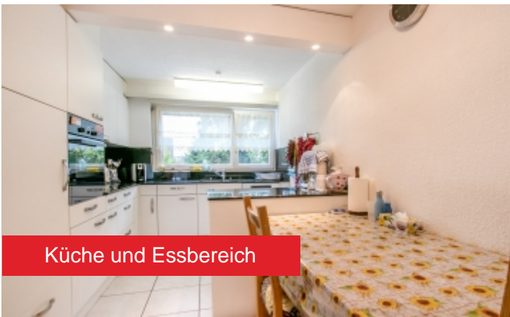
Küche und Essbereich