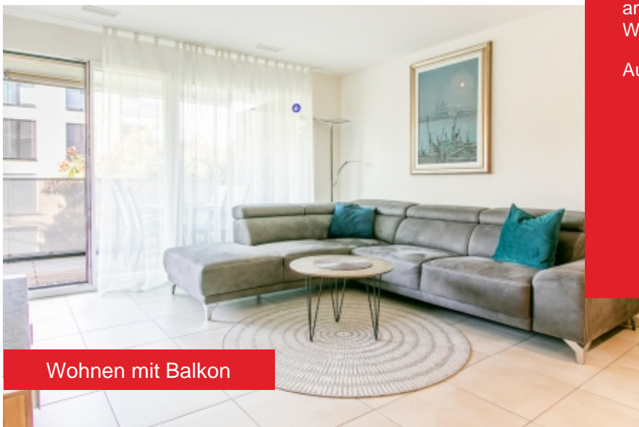
Wohnen mit Balkon