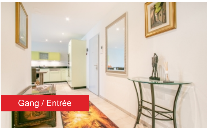
Gang / Entrée