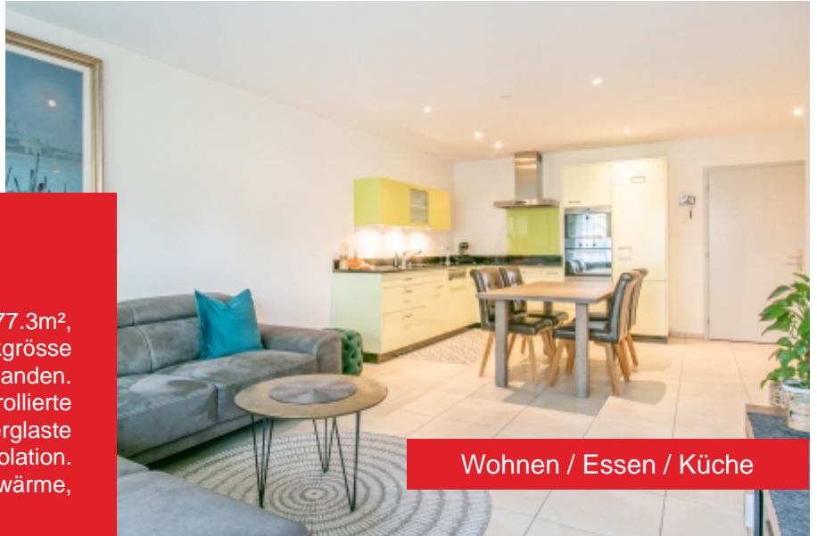
Wohnen / Essen / Küche

Mit unserer virtuellen 360-Grad-Tour können Sie bereits die ersten Eindrücke dieser tollen Liegenschaft gewinnen. Sehr gerne zeigen wir Ihnen die Wohnung direkt vor Ort und freuen uns auf Ihre Kontaktaufnahme