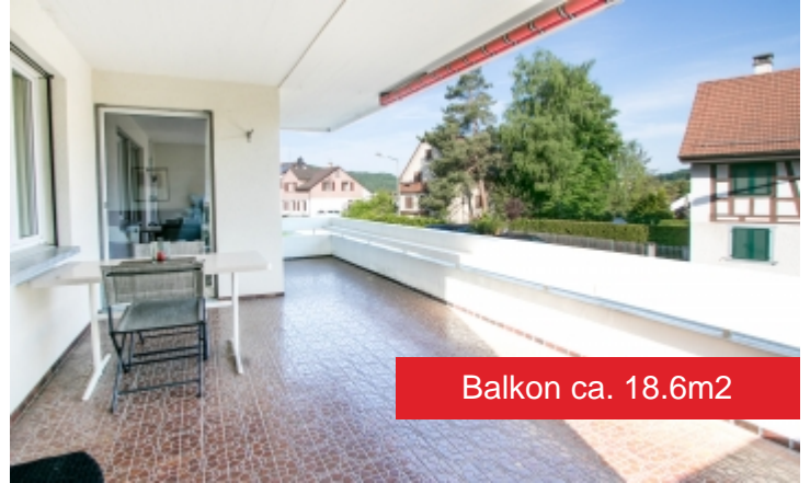
Balkon ca. 18.6m 2