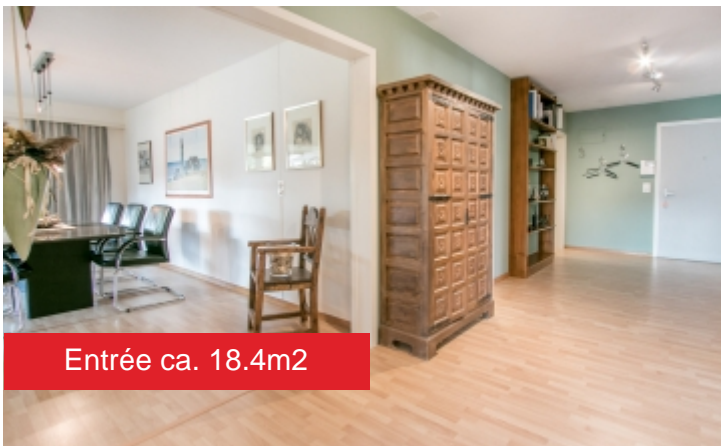
Entrée ca. 18.4m 2