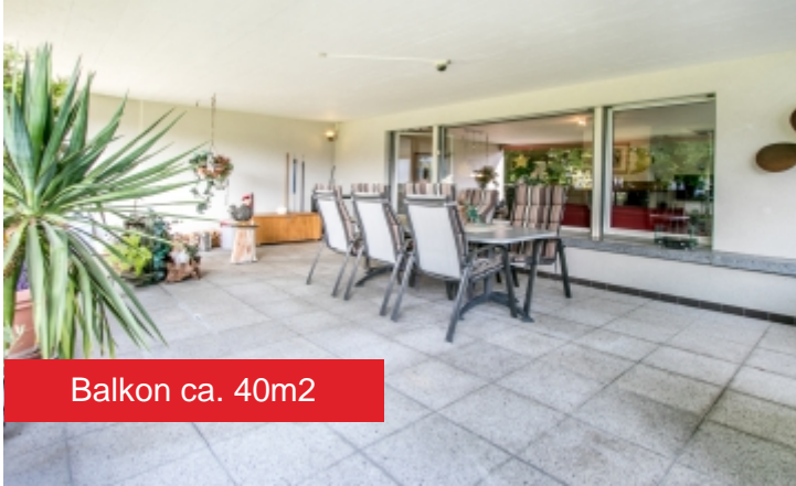
Balkon ca. 40m 2