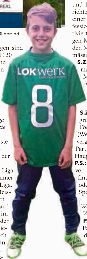
Das Lokwerk sponsort Trikots.

P.S.: Die erste Faustballmannschaft spielt in der Wintersaison (Halle) in der 1. Liga und im Sommer (Feld) in der 2. Liga. Neben den Meisterschaftsspielen im Sommer auf der Wiese und im Winter in der Grosshalle spielen wir auch regelmässig an regionalen Turnieren. Die Aktivriege nimmt