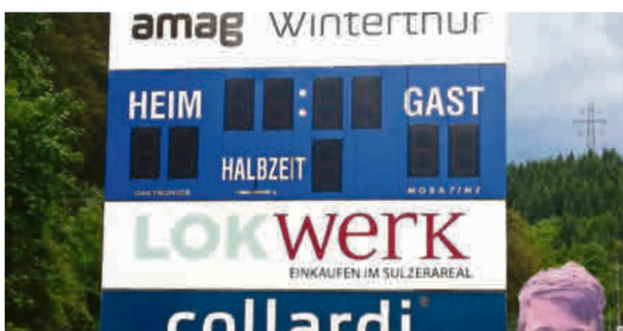
Logopräsenz auf der Reitplatz-Matchuhr des FC Töss.

P.S.: Das Lokwerk hat uns bei der Neuanschaffung von rund 50 Tenues für die kleinsten Faustballspieler bis zur Seniorenmannschaft unterstützt. Zudem konnten wir dank dem Sponsoring auffällige, gelbe Lokwerk-Trainings- beziehungsweise Freizeit-T-Shirts drucken lassen, welche wir den Kindern im Vereins gratis abgeben konnten.